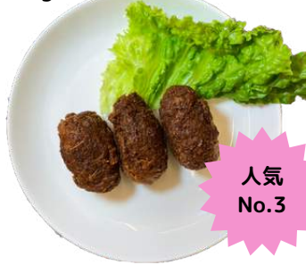
ベジ唐揚げ(しょうゆ) vegan fried chicken