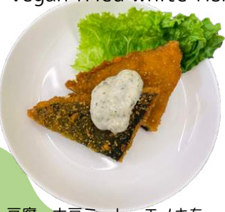
白身風フライ vegan fried white fish

豆腐、大豆ミート、エノキを 使用したベジ白身風フライ。 外はサクサク、中はふんわり