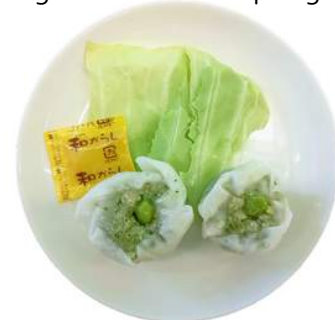
ベジシュウマイ vegan shumai dumpling