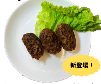
ベジ唐揚げ(磯風味) vegan fried chicken