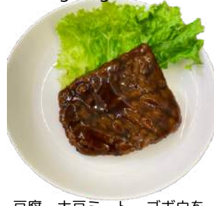
ウナギ風かば焼き vegan grilled eel

豆腐、大豆ミート、ゴボウを 使用したベジウナギ風かば焼き。 ふっくらなめらかな質感です。