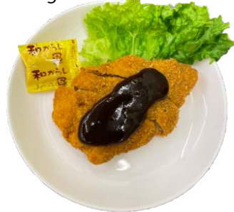
ベジとんかつ vegan cutlet