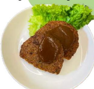
ベジハンバーグ vegan hamburg stake