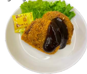
ベジメンチカツ vegan ground meat cutlet