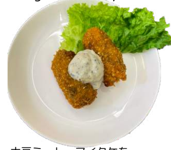
カキ風フライ vegan fried oyster

豆腐、大豆ミート、マイタケを 使用したベジカキ風フライ。 マイタケの香りがまるでカキのような味わいに