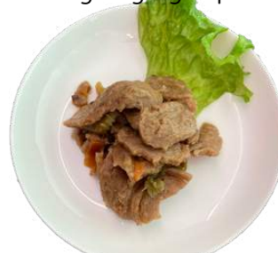
ベジ生姜焼き vegan ginger pork