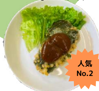
ピーマンベジ肉詰め stuffed green pepper