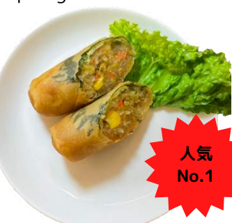
シソ春巻き spring roll with shiso