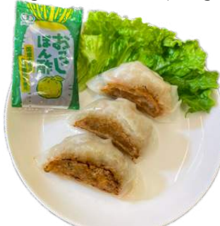
ベジ餃子(焼き) vegan fried dumpling