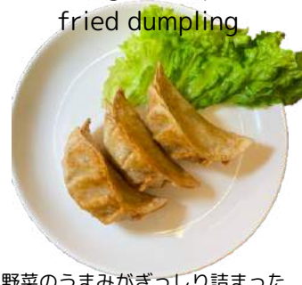
ベジ餃子(揚げ) vegan deep fried dumpling