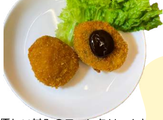
ベジコロッケ (コーンクリーム&カレー) vegan croquette (corn&curry)