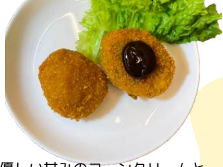
ベジコロッケ (コーンクリーム&カレー) vegan croquette (corn&curry)