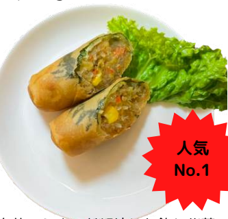
シソ春巻き spring roll with shiso