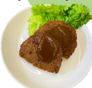
ベジハンバーグ vegan hamburg stake