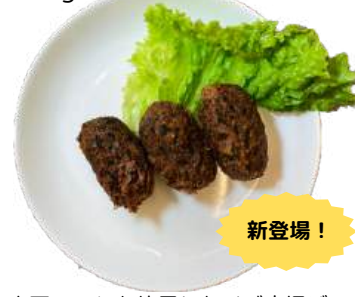
ベジ唐揚げ(磯風味) vegan fried chicken