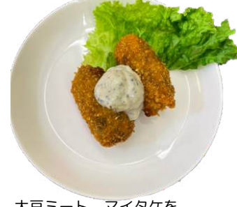
カキ風フライ vegan fried oyster

豆腐、大豆ミート、マイタケを 使用したベジカキ風フライ。 マイタケの香りがまるでカキのような味わいに