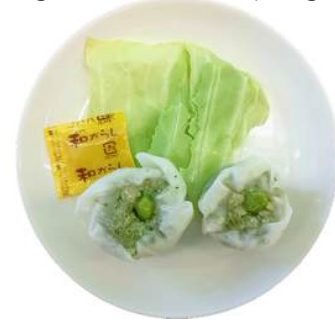
ベジシュウマイ vegan shumai dumpling