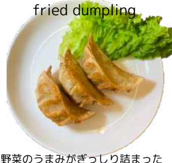
ベジ餃子(揚げ) vegan deep fried dumpling