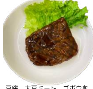
ウナギ風かば焼き vegan grilled eel

豆腐、大豆ミート、ゴボウを 使用したベジウナギ風かば焼き。 ふっくらなめらかな質感です。