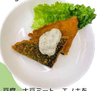
白身風フライ vegan fried white fish

豆腐、大豆ミート、エノキを 使用したベジ白身風フライ。 外はサクサク、中はふんわり